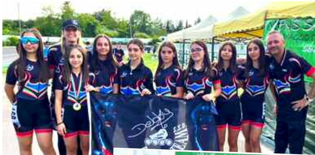
Nella foto, il gruppo della Debby Roller Team