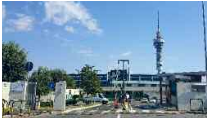
Nella foto, la sede della SOGEI

Sono 18 le persone indagate nell'inchiesta della Guardia di Finanza, che ha portato all'arresto, in flagranza di reato, dell'attuale direttore generale Business di Sogei, P.I.. L'uomo è stato fermato lunedì sera a Roma mentre intascava una mazzetta da 15 mila euro da un imprenditore. Quattordici le società coinvolte nell'indagine in cui si ipotizzano, a vario titolo, i reati di corruzione e turbativa d'asta. A P.I., che si trova agli arresti domiciliari, viene contestato il reato di corruzione perchè con "più