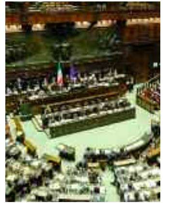
Nella foto, una veduta della Camera

Sul tavolo a gennaio ci sarà poi la rottamazione, proposta dal Carroccio, che non ha trovato spazio in manovra. La Lega non arretra e ha già annunciato che riproporrà la sua storica battaglia, con la rateizzazione in 10 anni (e non in 5 come la rottamazione quater) e 120 rate in cui pagare solo la parte capitale dovuta al fisco senza interessi e sanzioni. Non solo, "sicurezza, giustizia, sostegno all'economia e iniziare a lavorare bene con la nuova amministrazione Usa, magari affiancandoli nel chiedere immediatamente i finanziamenti all'Oms" - le priorità elencate dal senatore leghista Claudio Borghi.