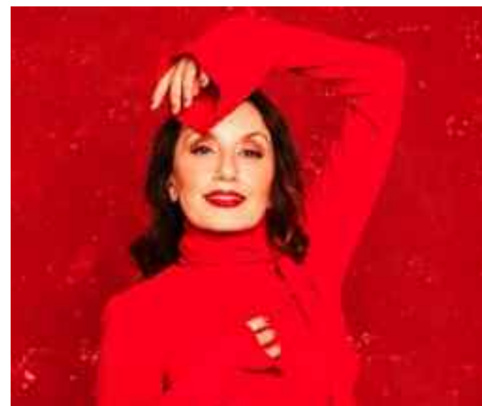
Nella foto: il Pianista Mikhail Pletnev. Voce artistica Luz Casal