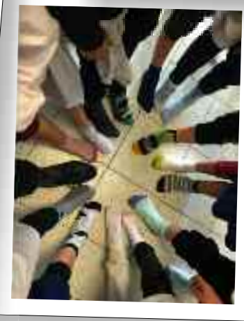
Falcone, Rodari e Livatino, gli alunni della scuola primaria hanno realizzato elaborati artistici e creativi, personalizzando calzini di carta con colori,