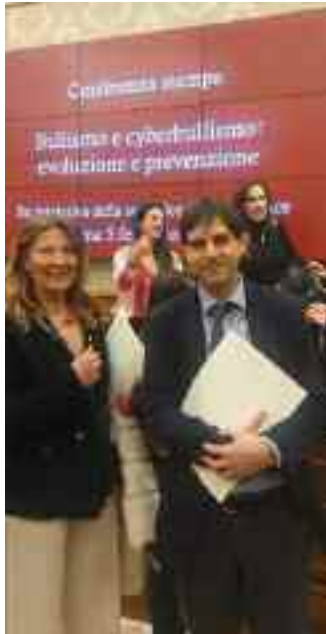
rata dalla Sen. Giusy Versace. L'evento ha visto la partecipazione di autorevoli figure

L'Istituto Comprensivo Ladispoli 1 continua a distinguersi per il suo impegno nella prevenzione e nel contrasto ai fenomeni di bullismo e cyberbullismo, ribadendo il ruolo cruciale della scuola come presidio educativo e osservatorio privilegiato su queste problematiche. Nella prestigiosa Sala Conferenze Stampa del Senato, la Dirigente Scolastica, prof.ssa Antonella Mancaniello, accompagnata dal prof. Alessio Giannone, referente per il Team Anti-Bullismo della scuola, ha rappresentato l'istituto in occasione della conferenza stampa dal titolo "Bullismo e Cyberbullismo: evoluzione e prevenzione", un'importante iniziativa promossa e mode-