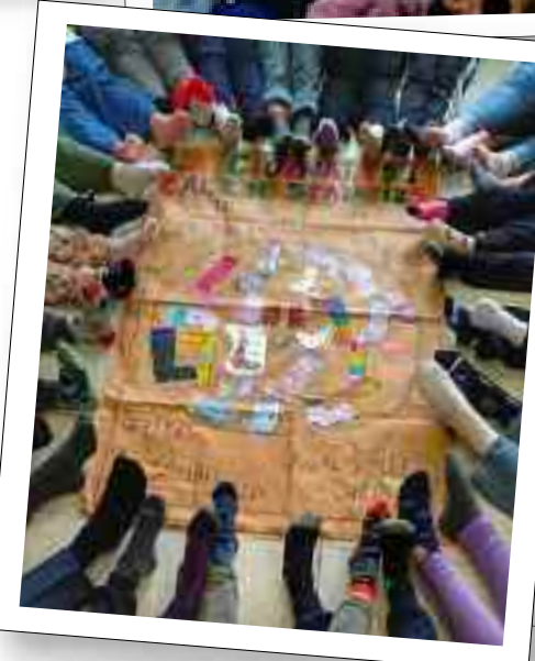
Hanno poi ascoltato racconti e favole sul valore della diversità, riflettendo su come le differenze possano arricchire ognuno di noi. Nei plessi

e paritarie o i primi tre anni di un percorso triennale IeFP (Percorsi triennali di istruzione e formazione professionale). La domanda di partecipazione dovrà essere: compilata esclusivamente sul modello predisposto dalla Regione Lazio, disponibile sul sito istituzionale del Comune di Ladispoli; compilata, nel caso, per ciascun figlio; trasmessa entro e non oltre il 21 marzo 2025 al seguente indirizzo: Comune di Ladispoli - Ufficio Pubblica Istruzione - Piazza Falcone, 1, 00055 Ladispoli, tramite Pec all'indirizzo comunediladispoli@certificazioneposta.it o a mano al Protocollo generale dell'Ente.