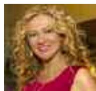
di Manuela Biancospino

La musica certamente è un mezzo per trasmettere emozioni ma è sicuramente anche un ottimo strumento per far conoscere la cultura, la storia ed i costumi di un Paese ed è quello che sta facendo da ormai 75 edizioni il Festival di Sanremo, il Festival per eccellenza della canzone italiana che si tiene ogni anno nella città ligure dal 1951. Il luogo della kermesse era in origine il salone delle feste del casinò di Sanremo e dal 1977 si svolge presso il teatro Ariston. Dal 1956 il vincitore ha diritto di rappresentare l'Italia all'Eurovision Song Contest che quest'anno si svolgerà a Basilea, in Svizzera. Il talento degli artisti e dei compositori italiani è conosciuto davvero in tutto il mondo e le melodie e le voci dei cantanti del nostro paese suscitano sempre forti emozioni.