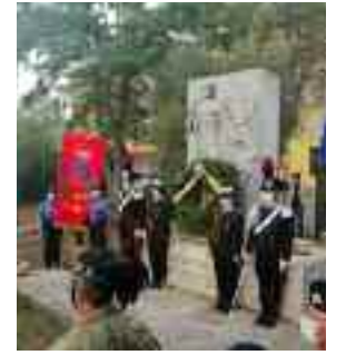
Fiumicino conferisce Cittadinanza Onoraria a Salvo D'Acquisto