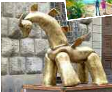
Nella foto, la scultura Dynowish