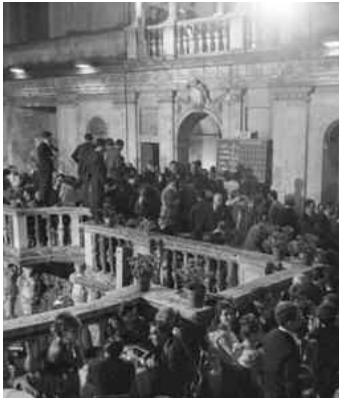
Nella foto, Premio Strega 1962 ? Foto di Carlo Riccardi ' Archivio Riccardi S

Nel foyer del Teatro De La Salle, giovedì 3 aprile sarà inaugurata a Benevento, a cura del Direttore "Fondazione Benevento Città Spettacolo" Renato Giordano, la mostra fotografica "Il primo rigo affascina, tutto il libro Strega", un affascinante viaggio negli anni d'oro del "Premio Strega" attraverso gli scatti